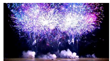
Tableau constitué de plusieurs engins pyrotechniques unitaires disposés à une certaine distance les uns des autres, fonctionnant ensemble et destinés à utiliser un site sur la plus grande largeur possible.